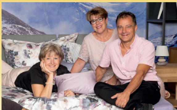
Team Bettenhaus Bella Luna