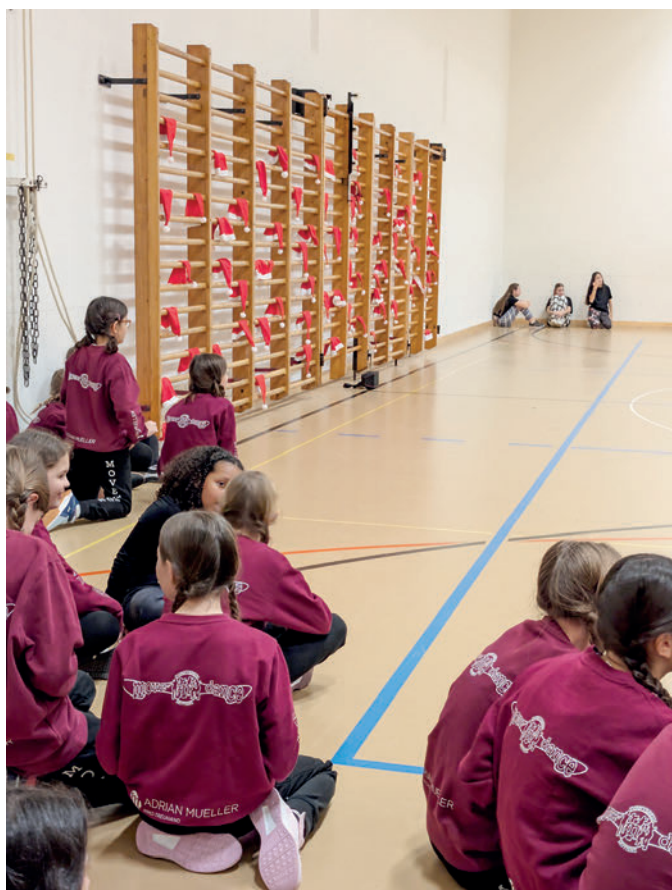
Spannung vor der Show

Unser Weihnachtsauftritt war auch in diesem Jahr ein voller Erfolg 🥳 und wir sind unglaublich stolz auf die Leistung unserer drei Move'n'Dance-Gruppen!