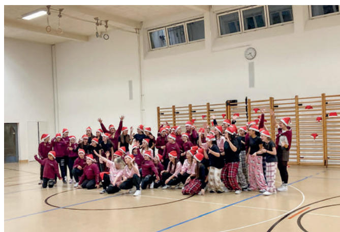
Schlusspose alle MnD-Gruppen

Wenn du Freude am Tanzen hast und über 18 Jahre alt bist oder jemanden kennst, der Lust hätte mitzumachen, melde dich gerne bei uns 🌟🎄.