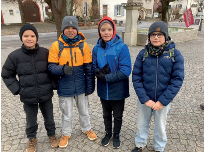
Das Siegerteam der 7.2 km-Strecke