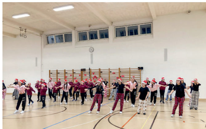
Weihnachtstanz der drei MnD Gruppen

MnD3 schaut dem Auftritt von MnD2 zu deutlich spürbar – genau das macht solche Abende