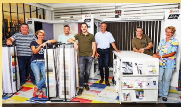
Team Mössinger AG

DieRaumausstatter.ch Mühlemattstr. 27, 4104 Oberwil Tram 10 / Bus 61+64 (Hüslimatt)