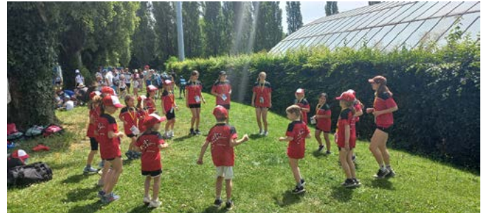
Jugi 1 und 2 in Lausanne

unser Mittagessen. Mit dem Bus ging es zum nächsten Einsatz, der Pendelstafette und dann wieder zurück zum Rucksackdepot. Dank fehlerfreien Wettkämpfen und einem Resultat im mittleren Bereich der Rangliste in ihrer Division dürfen die Kinder stolz sein.