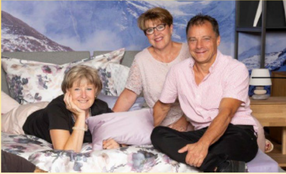
Team Bettenhaus Bella Luna