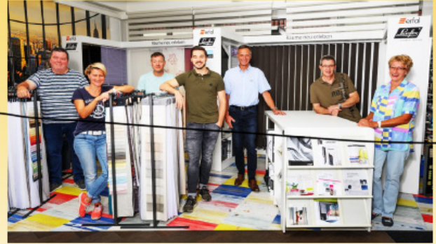
Team Mössinger AG

DieRaumausstatter.ch Mühlemattstr. 27, 4104 Oberwil Tram 10 / Bus 61+64 (Hüslimatt)