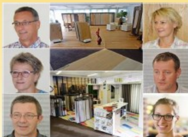
Mössinger Parkett Vorhänge