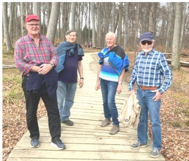
Im Wald und ohne „Corona-geschwängerte Luft“