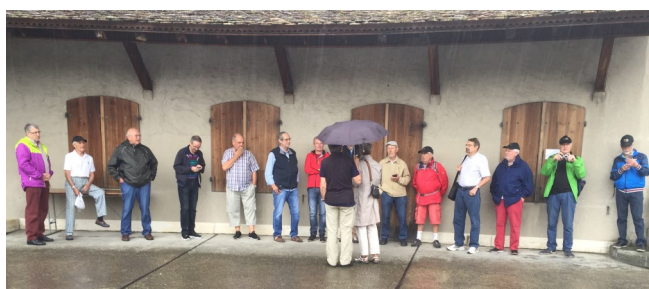
Das «Fritigstrüpli» in früheren Jahren