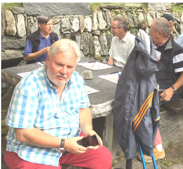
Unser Kassier, ein (ge)wichtiger Mann in unserer Riege.