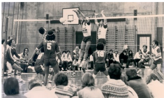
Herren 1 - Smash Winterthur 3:0, Nat. B Saison 1982/83