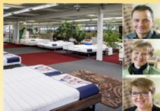
Bettenhaus Bella Luna