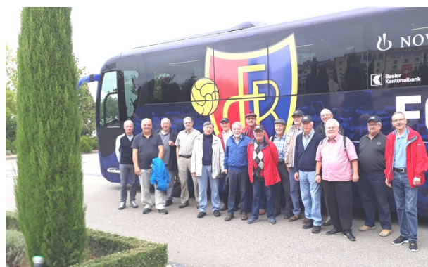
Aktuell 23 «Fritigstrüppler»

Bald kehren wir hoffentlich zahlreich zurück in die Normalität: