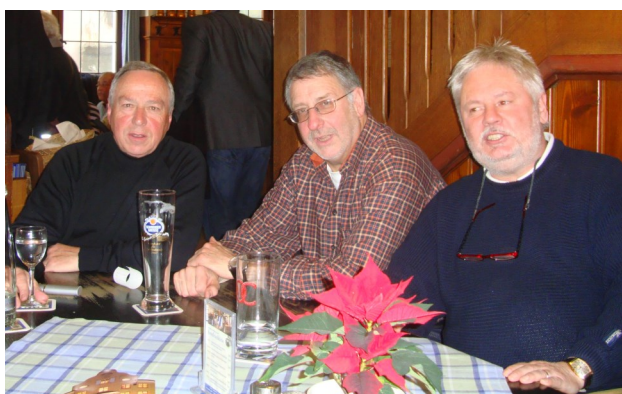
Von nun an war es das «Fritigstrüpli»

Als die Freitagsriege der Männerriege plötzlich ohne Leiter war, drohte die Auflösung der Riege. Gerade zu einem Zeitpunkt, wo wir altersmässig das Turnen am nötigsten hatten. Nach mehreren Krisensitzungen kamen die Retter.