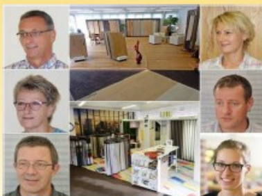
Mössinger Parkett Vorhänge