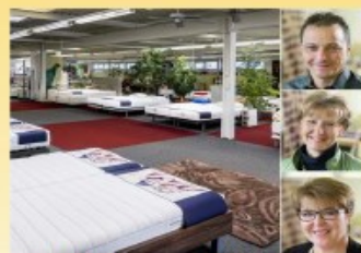
Bettenhaus Bella Luna