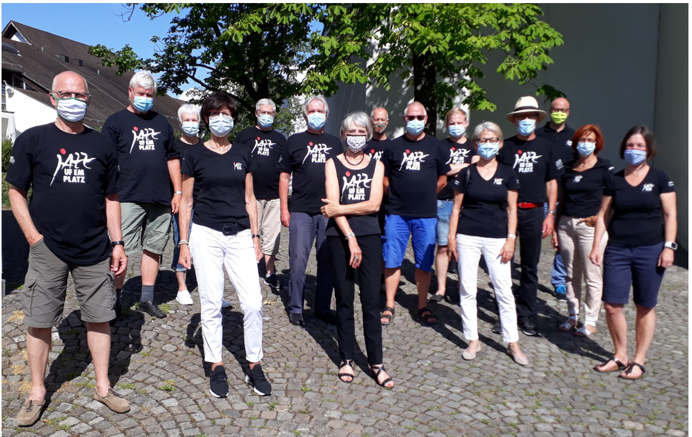
Unten: selbstredend (beides vorbildlich)