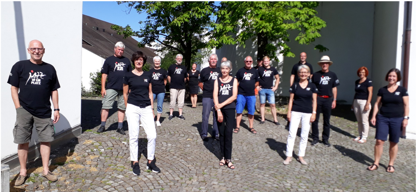
Oben: mit obligatorischem „Corona-Abstand“

Das arbeitswillige, aber am 11.07.20 leider arbeitslose OK „Jazz uf em Platz“