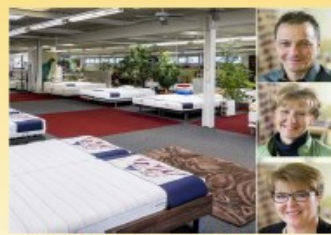
Bettenhaus Bella Luna