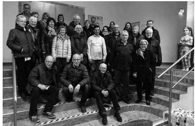
Vor dem Allerheiligsten mit unserem „Führer“

Der offerierte alkoholfreie Apéro mit speziellen Beigaben hat jedenfalls allen geschmeckt.