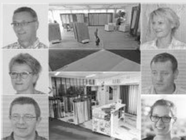
Mössinger Parkett Vorhänge