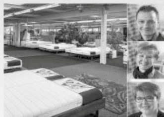
Bettenhaus Bella Luna