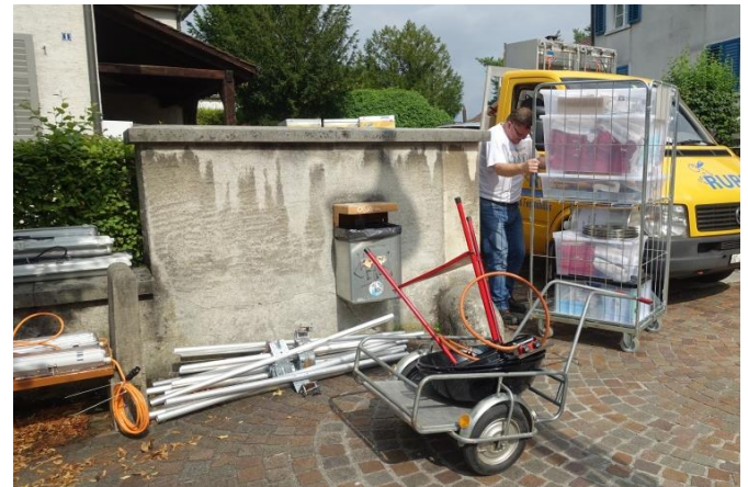
- da ist fast kein Durchkommen mehr, um all die angelieferte Ware ins Lager zu bringen!