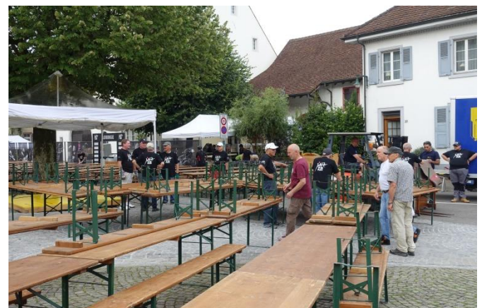
- um alle Tische und Bänke hinzustellen braucht es einige fleissige Frauen und Männer