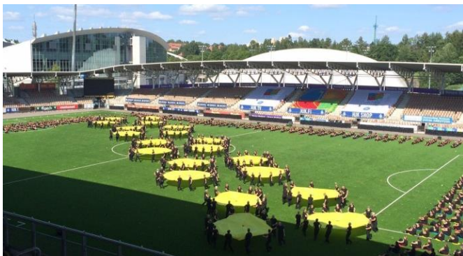
GG55+ Vorführung mit den Fallschirmen