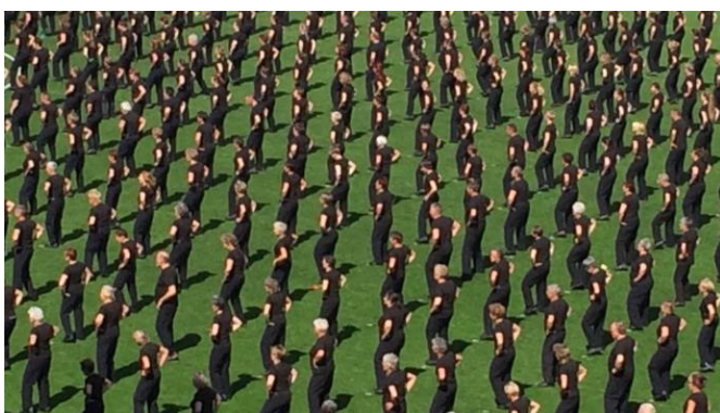
Das „Finale“ (GG35+ und GG55+)

Bericht: Karl Flubacher