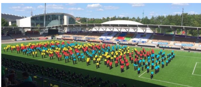
GG35+ Vorführung mit dem Schlauch