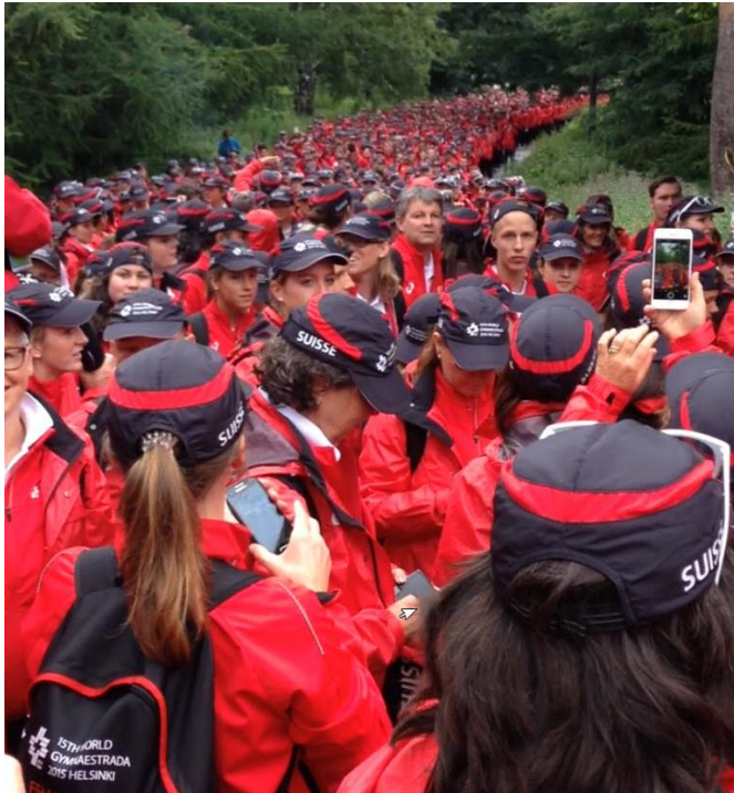
Eindrucklich: Die nicht enden wollende Kolonne der 3900 Schweizer beim Warten zum Einmarsch zur Schlussfeier.