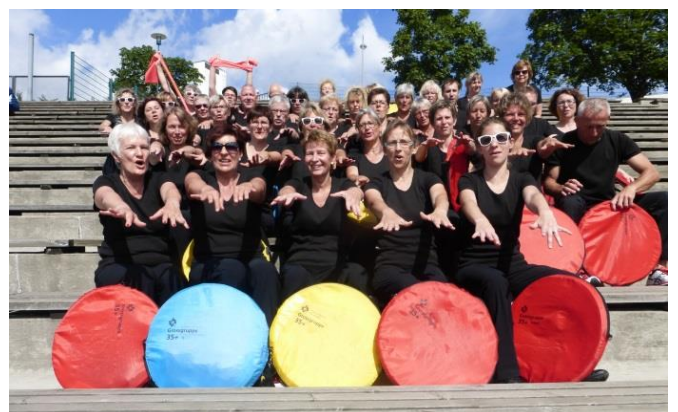
Die Baselbieter der GG35+